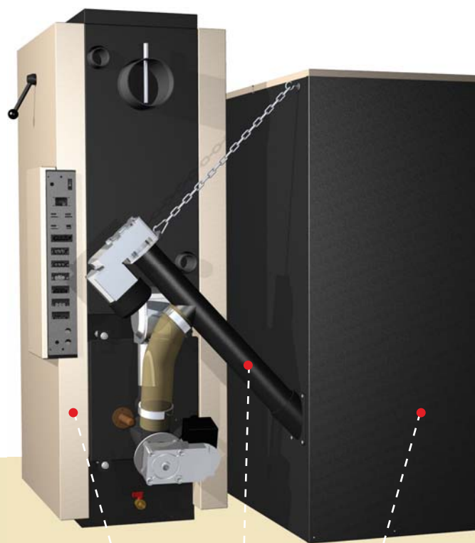
kotel | podavač P1 | zásobník